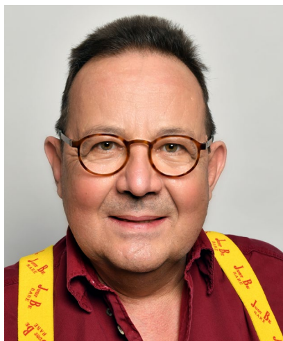
Laurent Duvanel Präsident Procap Schweiz

Bei Triage kommt mir persönlich als Erstes der SBB-Güterbahnhof Lausanne-Triage in den Sinn. An dieser Stelle geht es aber mitnichten um den Bahnverkehr, sondern um die Selektion von Patientinnen und Patienten beim Spitaleintritt vor dem Hintergrund der Pandemie.