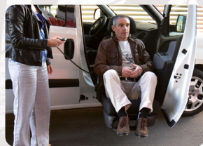
Ein- und Aussteigehilfen