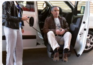
Ein- und Aussteigehilfen